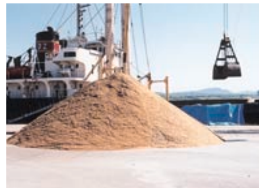
【砂の荷揚げ風景/H13. 6. 4】

将来、津軽地域の砂の枯渇が危惧される中、地元の砂に代わる供給地を探るべく対岸諸国に目を向けたこうした取り組みは、建設資材(砂、砂利、碎石等)が主要取扱品目である当港の利用促進を図るだけでなく、対岸諸国との交流を進める上で今後さらに重要になるものと思われます。