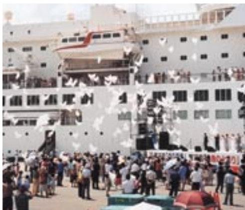
【鯉ヶ沢地区オープニングセレモニー】