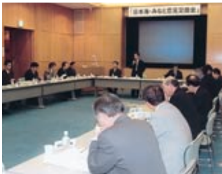
【十勝港関係者を招いての意見交換会】

助言者からは、それぞれ専門の立場から同港の利活用の方法について意見が述べられ、今後の利用促進活動の方向性を示す実りあるセミナーとなりました。