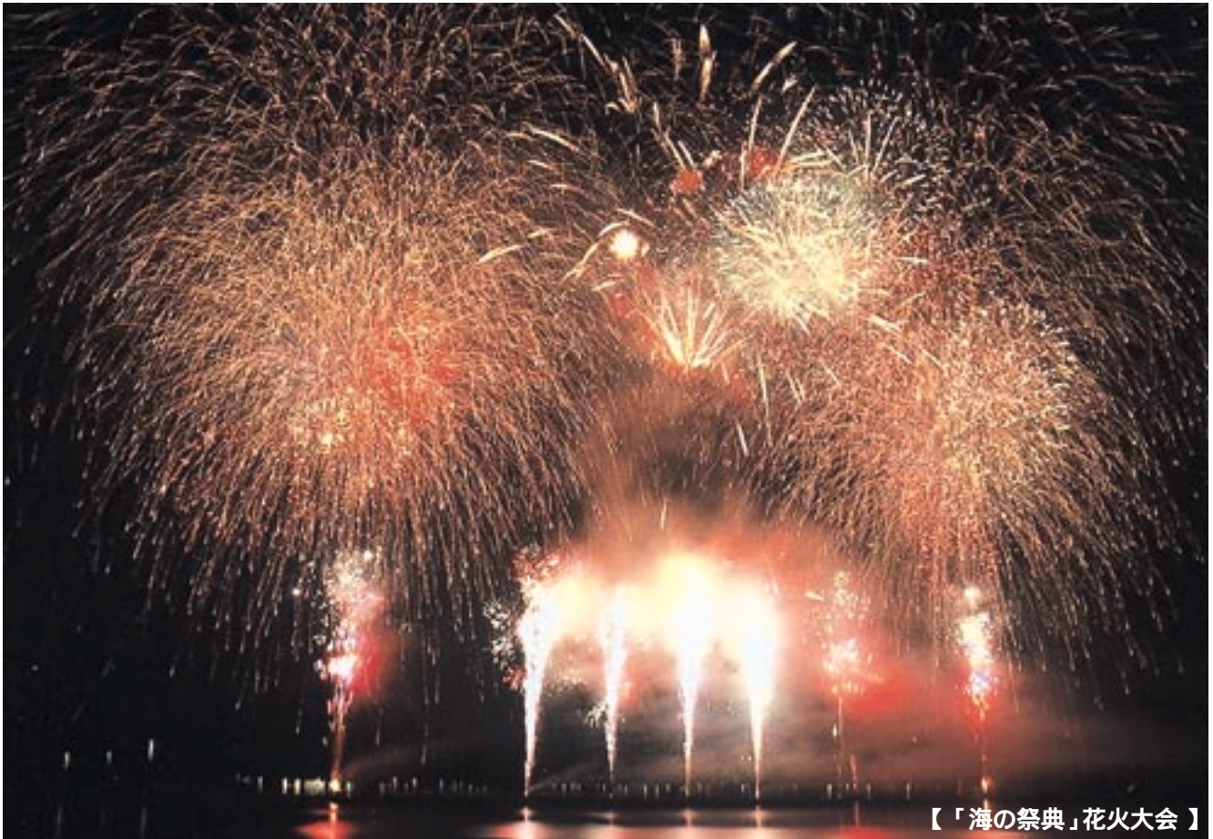
【「海の祭典」花火大会】