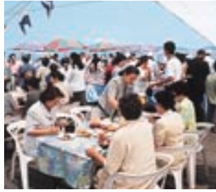
【船上でのデッキランチ】

今回「ふじ丸」は、「海の日」ゆかりの青森港、函館港に寄港し、また「海の祭典」各会場を經由するなど、多くの乗船客で賑わい、各地のイベントに華を添えていました。