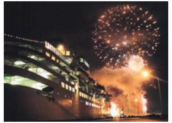
【函館港での花火大会】