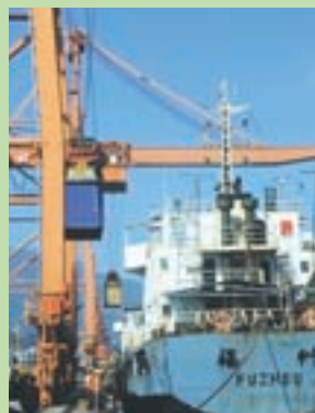
【青州港コンテナヤード】

川砂の一大供給地である福州市、国家的取組みで目覚ましい発展を遂げる上海市、これら両市の港湾関係機関・施設を訪問し、七里長浜港の将来を考える上で、対岸諸国との交流の必要性を再認識してきました。