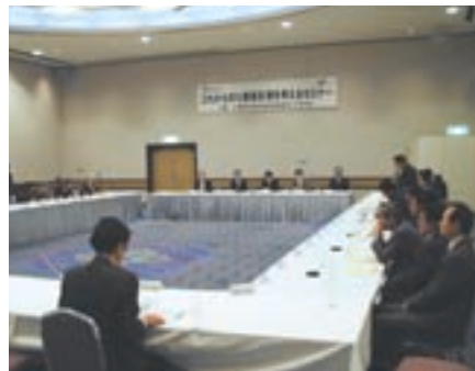
【七里長浜港のこれからの考えるセミナー】