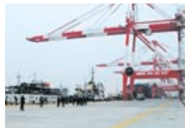
【上海港外高橋コンテナ2号埠頭】