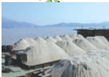
【ミソ江の川砂・青州港採砂場】