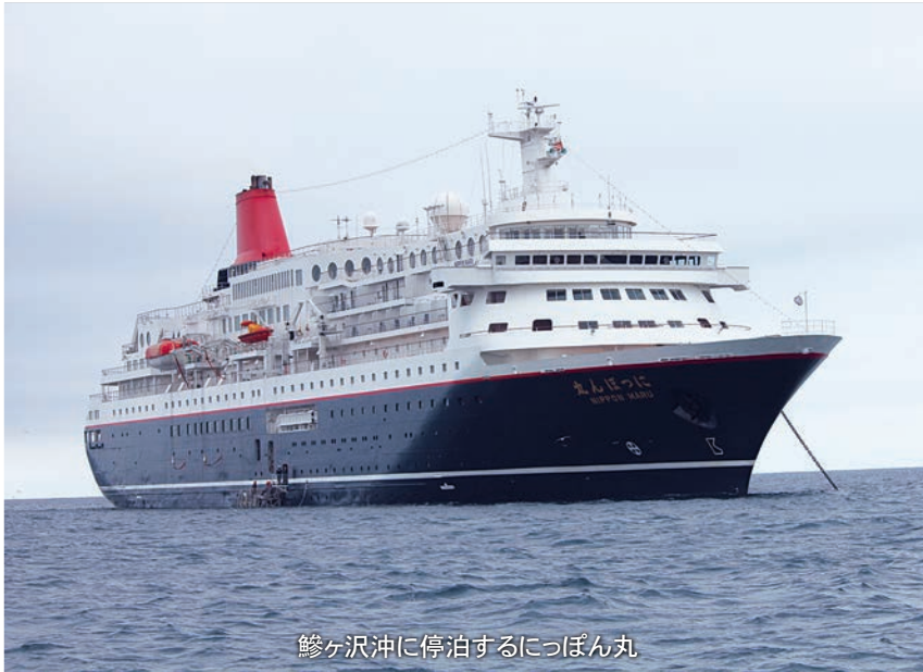
鰯ヶ沢沖に停泊するにつぼん丸

七里長浜利用促進協議会では、今後も客船誘致も含め、七里長浜港の利用促進に努めていくことにしています。