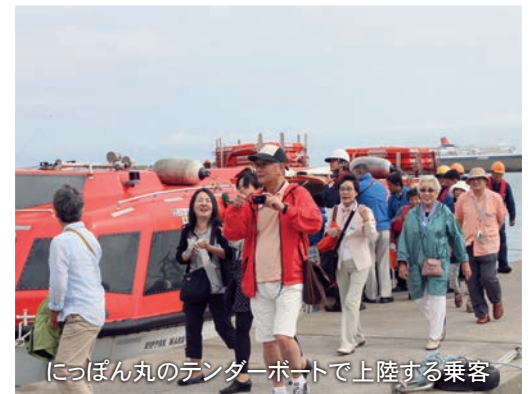
につぼん丸のテンドーボートで上陸する乗客