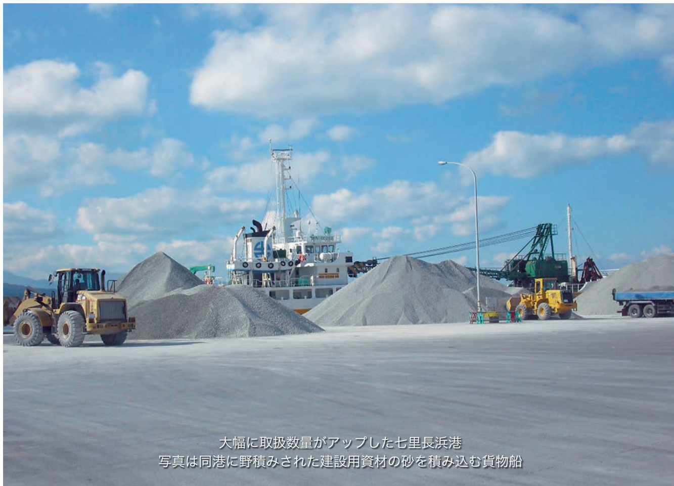
大幅に取扱数量がアップした七里長浜港 写真は同港に野積みされた建設用資材の砂を積み込む貨物船