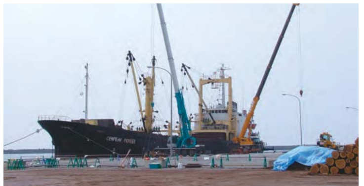
県産材が積荷される様子