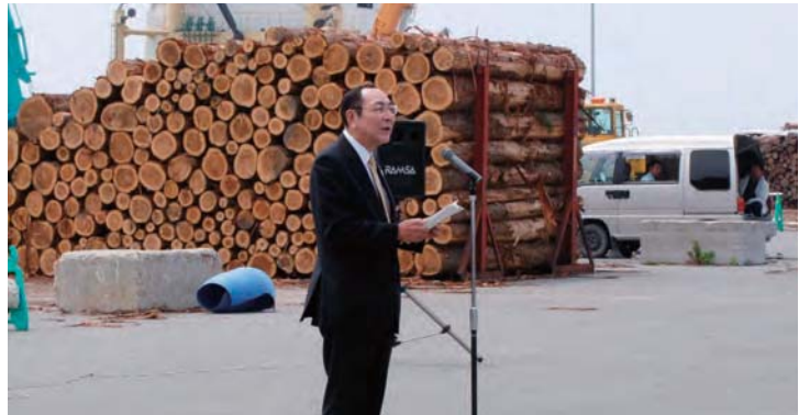
挨拶をする青山祐治副知事

初の輸出となった木材は、津軽地域で生育したスギやアカマツの丸太15,720本(1.932 t)で、住宅・家具等の建材として利用され、10月18日には2回目となる32,161本(3,156 t)が中国上海へ輸出されました。今後、国内外の安定的な県産材の海上輸送が期待されます。